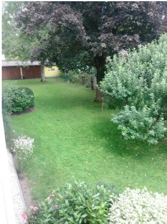
Ausblick in den Garen